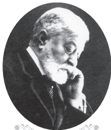
Francesco Paolo Tosti (1846-1916)

その後、奈良とイタリアが、より豊かな文化交流を行う事業の展開を目指し、奈良芸能文化協会の国際交流部門として〈日本トスティ協会〉を設立しました。F.P.トスティ歌曲の普及と、若い芸術家たちの育成や地域文化力の向上を目指して、トスティ歌曲を中心とする「コンサート」「コンクール」「セミナー」「イタリア現地研修会」等を開催し、F.P.トスティ翻訳本『トスティ ある人生の歌』と「F.P.トスティ歌曲訳詩本」の発行等、イタリアトスティ協会と連携し積極的にトスティ歌曲の研鑽、普及を行っています。